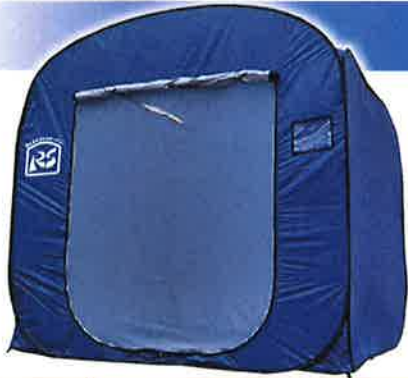
出入口（閉じた状態）